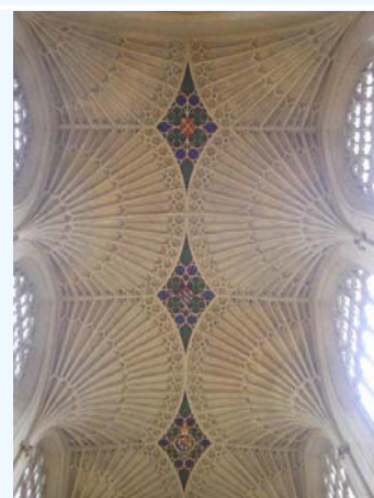
Cúpula en abanico del techo de la Abadía Bath, Inglaterra

Hazrat Inayat Khan decía "El absoluto de la Vida, de donde ha surgido todo lo que se siente, se ve, y se percibe, y en el cual con el tiempo todo se vuelve a fundir, es un vida silenciosa, inerte, eterna que entre los Sufies se denomina Dhat (zat). Cada movimiento que surge de esta vida silenciosa es una vibración y creador de vibraciones". El señala la manera Sufí de visualizar al ser humano de pie en un portal (darwesh) entre el orden de ser relativo y el Absoluto-entre la quietud y el movimiento, interno y externo, "este mundo" y "ese mundo". En nuestro trabajo con las Danzas, existe un potencial para unificar con una fuerza que está enraizada en lo silencioso y eterno, sin embargo expresada a través de la creatividad sin límite que vemos en el mundo natural que nos rodea. A medida que nos volvemos más silenciosos y sintonizados con aquello de lo cual habla Hazrat Inayat Khan, lo que hacemos que surja refleja el poder y la creatividad de la Completitud en sí misma.