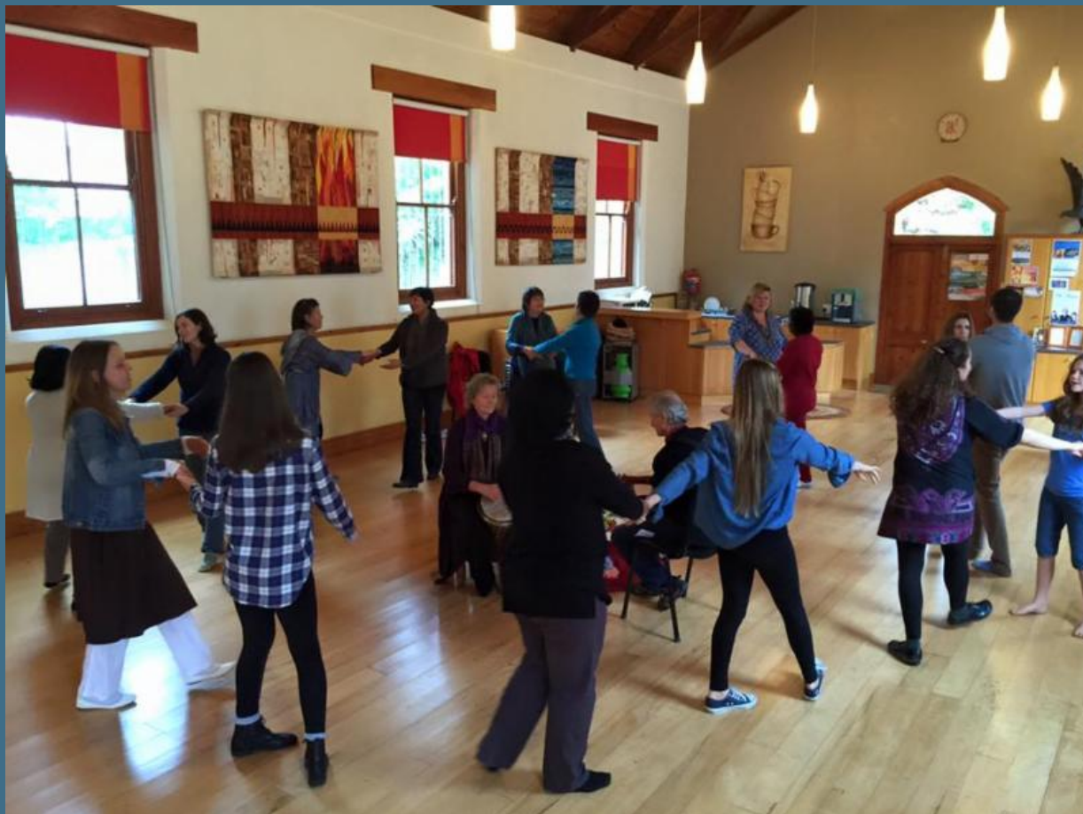
Начал танцы в Южной Африке в начале 2015 года.

Dances of Universal Peace International | (206) 367-0389 | inoffice@dancesofuniversalpeace.org | http://www.dancesofuniversalpeace.org P.O. 55994 Seattle, WA 98155-0994